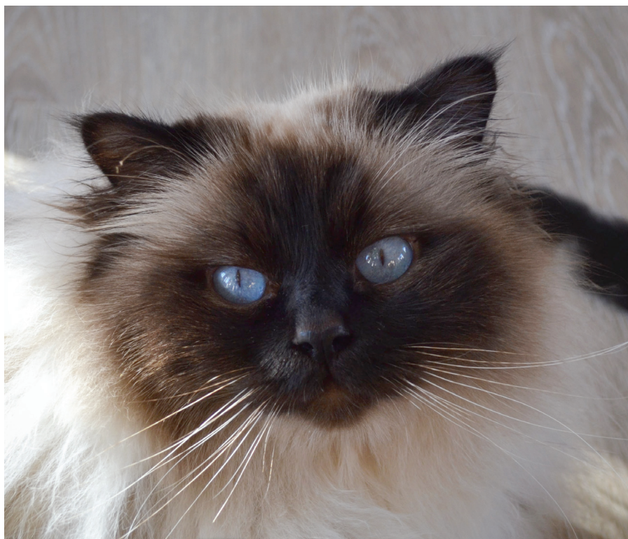
Wehnert's Vanderbilt (arkivfoto)

i stedet huske, at forældrevirus som udgangspunkt er fredelig og ufarlig, og at kun de færreste katte oplever at den muterer og bliver dødelig.