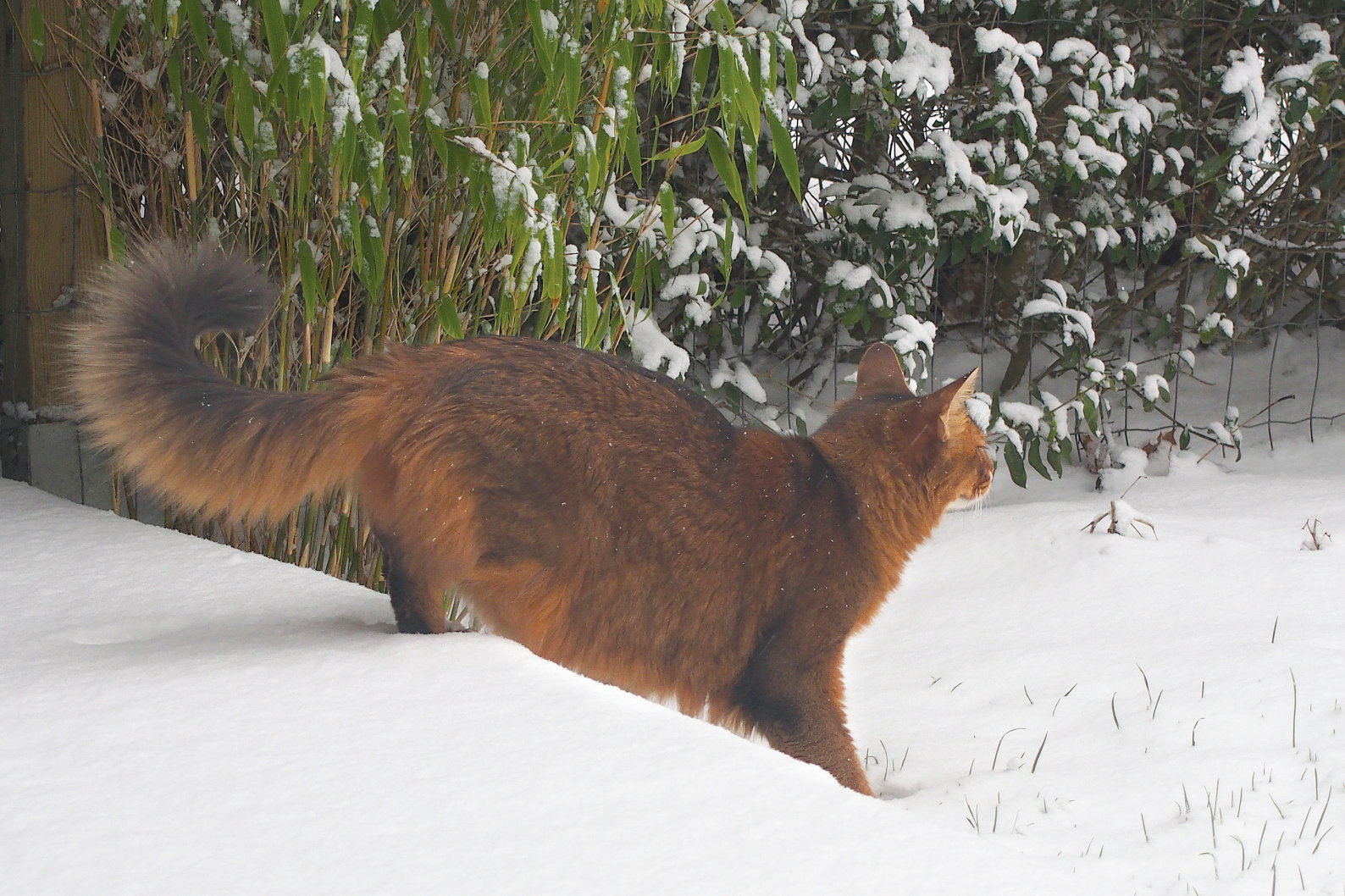
Dushara Tatters and Rags, SOM n, ejet af Finn Frode Hansen (arkivfoto)