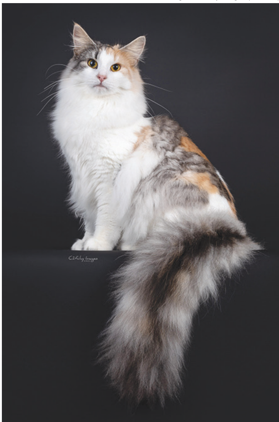
Tilia Nova's Z-n-Match