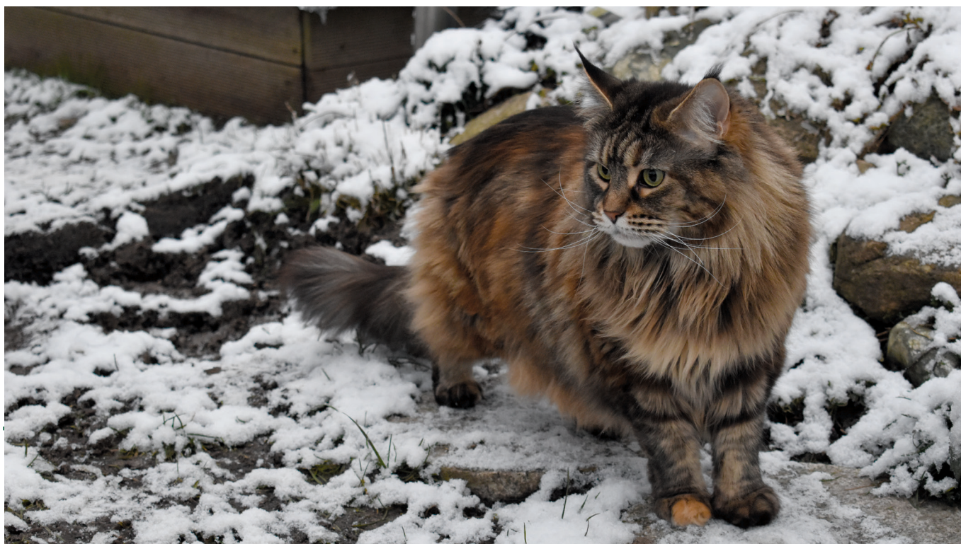
Spindes Fiona (arkivfoto)

Sykes, J.E., 2014. Feline Coronavirus Infection. Canine and Feline Infectious Diseases vol., pp. 195-208. Worthing, K.A., Wigney, D.I., Dhand, N.K., Fawcett, A., McDonagh, P., Malik, R., Norris, J.M., 2012. Risk factors for feline infectious peritonitis in Australian cats. J Feline Med Surg vol. 14, pp. 405-412.