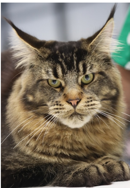
JYRAK Udstilling Hjørring 2023 EJ