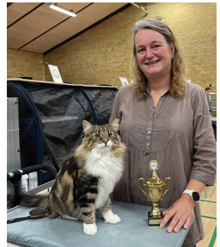
Racekatten sætter alle sejl til hvad enten det gælder udstilling eller sommerfest