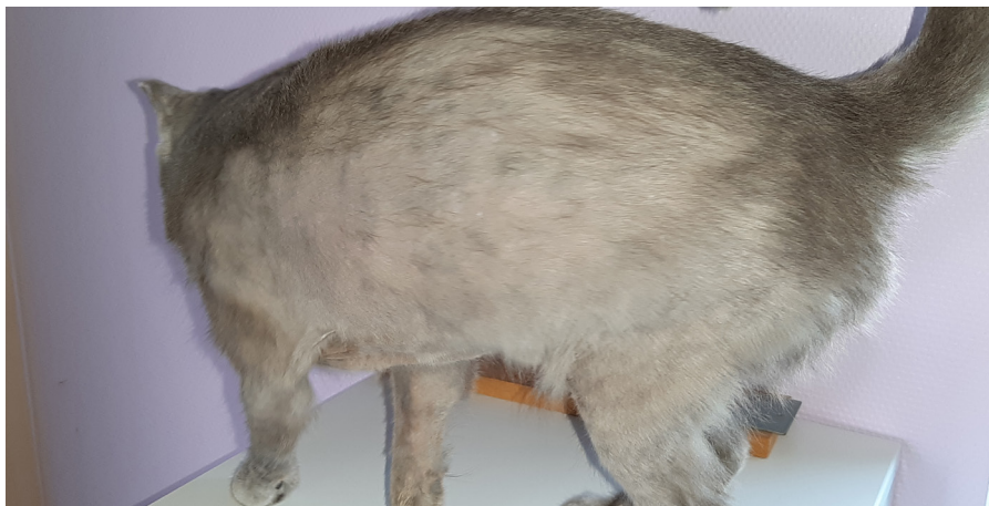
Med afpillet pels, august 2021