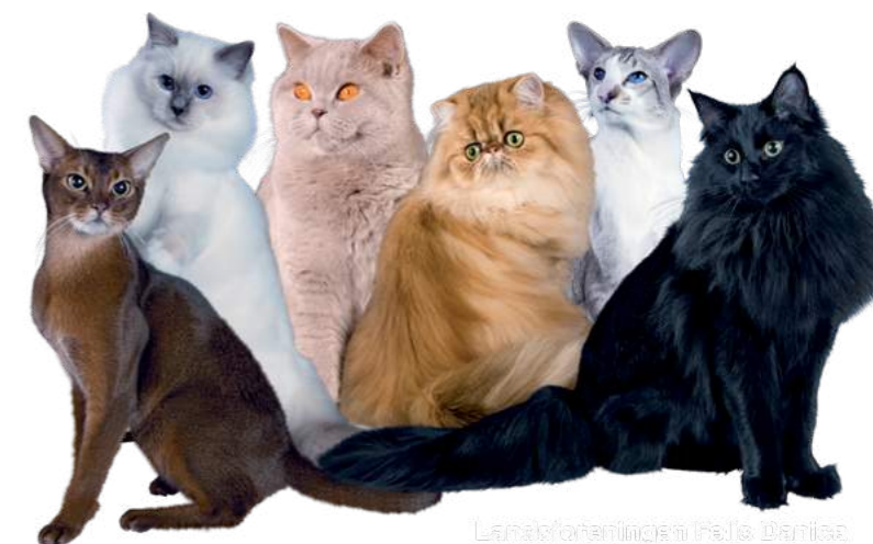
Landsforeningen Felis Danica