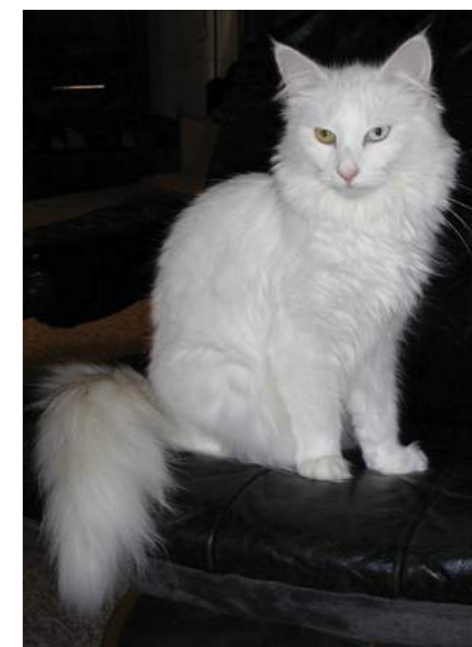
DK Tournesol's Snehvide